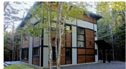
Le Plein Nord

Prix de vente : 660 000 $ Revenus annuels : 85 000 $