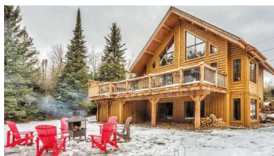
Le Mont-Tremblant 1

Prix de vente : 805 000 $ Revenus annuels : 100 000 $