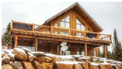
Le Mont-Tremblant 2

Prix de vente : 355 000 $ Revenus annuels : 42 000 $